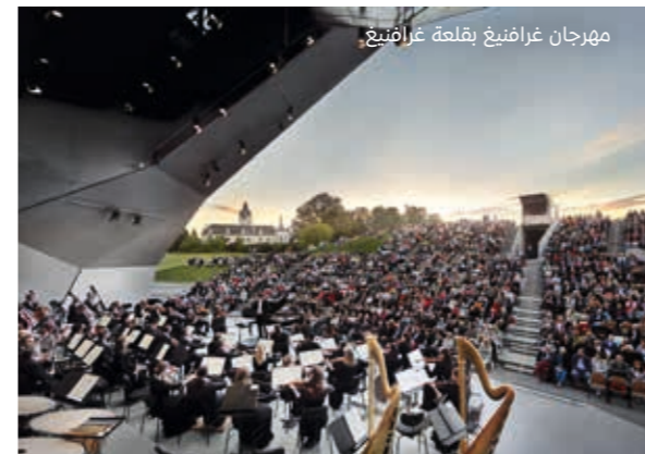
مهرجان غرافنيغ بقلعة غرافنيغ