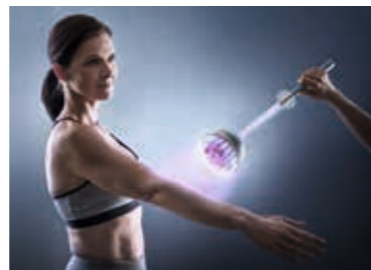
التيارات عالية التردد

والعلاج المستمر والحساس والفردى على يد المُعالج. كما يقدم مركز NUHR الطبي أيضًا طرق العلاج بالتمديد لتفريغ جذور الأعصاب المتهيجة وتلطيف الألم.