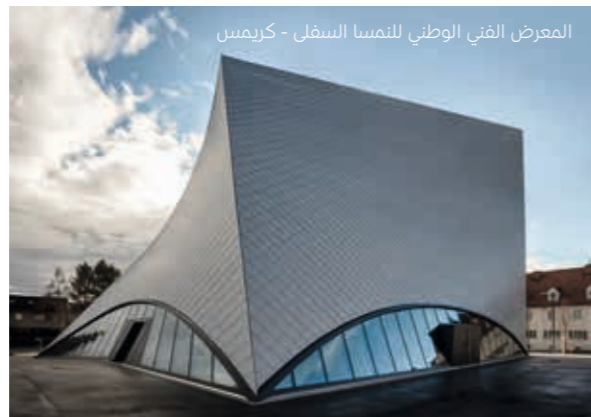
المعرض الفني الوطني للنمسا السفلى - كريمس