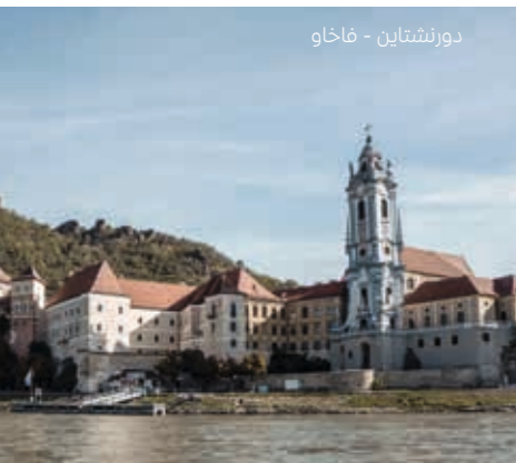
دورنشتاين - فاخاو