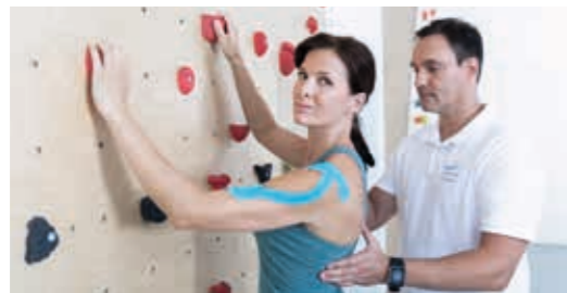
الجمباز العلاجي - جدار التسلق العلاجي