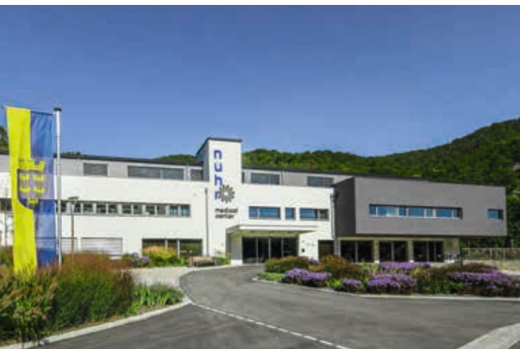
مركز NUHR الطبي الجديد في زينفتنبرغ