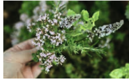
بستان الأعشاب والنباتات العلاجية

الطبيعة بقوتها الإبداعية وصفاءها وتناغمها: لذلك يوجد اللون الأخضر. بالعيش في تناغم مع الطبيعة، نجد السلام في أنفسنا. ولذلك فنحن نعتني بمنطقتنا الخارجية الشاسعة وحديقتنا العلاجية مع حب التفاصيل. وبهذا يمكن لنزلتنا أن إعادة شحن طاقتهم وتحقيق التجدُّد الذي جاءوا بحثًا عنه في مركز NUHR الطبي.